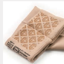
すり落ち防止加工